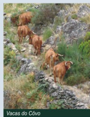
Vacas do Covo