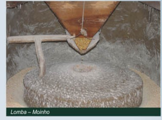
Lomba - Moinho